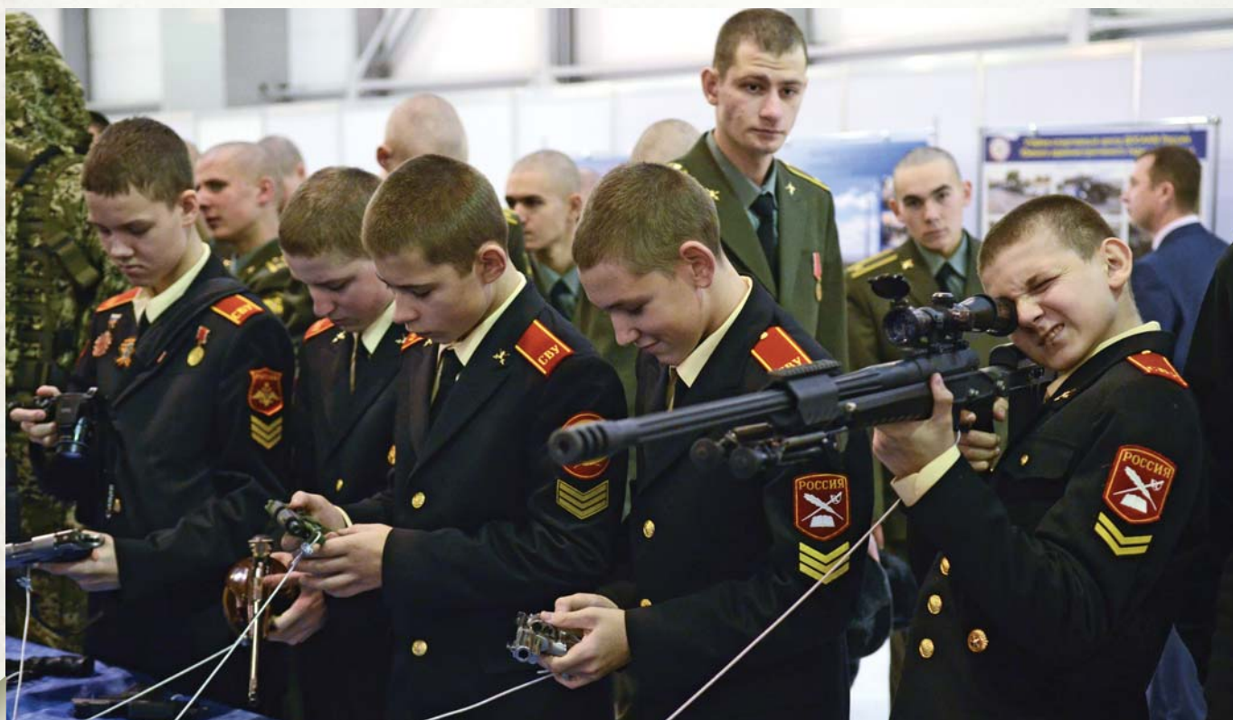
Future defenders of the Fatherland

А что посередине? Посередине Суэцкий канал. Речь идет об экономике. Сегодня международный терроризм, я смело об этом говорю, принимает новые формы.