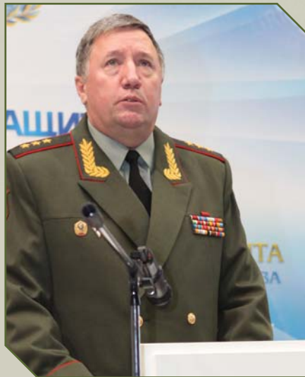
Commander-in-Chief of the Army, Colonel-General Vladimir CHIRKIN:

– Просит несколько слов сказать Главнокомандующий Сухопутными войсками генерал Чиркин. Я хочу сказать, что это сейчас он большой руководитель, а когда-то был командиром в 42-й дивизии в Грозном, причем реформировал ее в самый тяжелый период. Потом стал начальником штаба 58-й армии во Владикавказе, вынесшей на себе всю тяжесть и первой, и второй Чеченских компаний. Ну а потом был командующим, пожалуй, самой тяжелой у нас армии, в Забайкалье, то есть он знает не понаслышке что такое терроризм. Пожалуйста, Владимир Валентинович. ☉