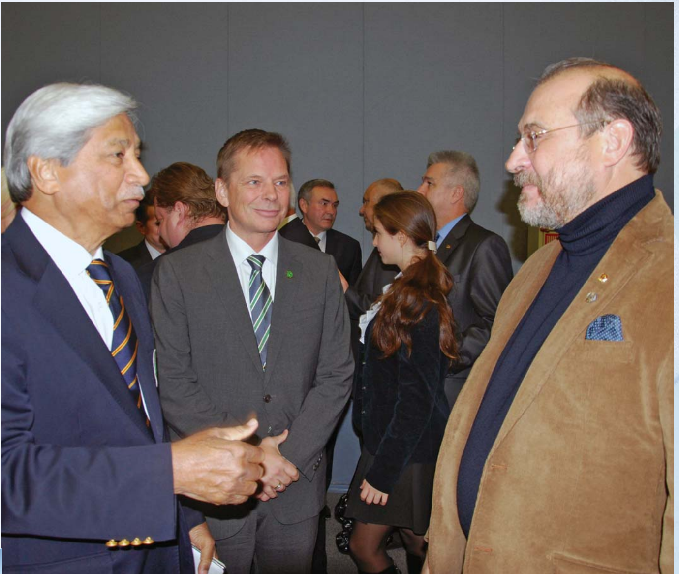
Delegation of the World Veterans Federation