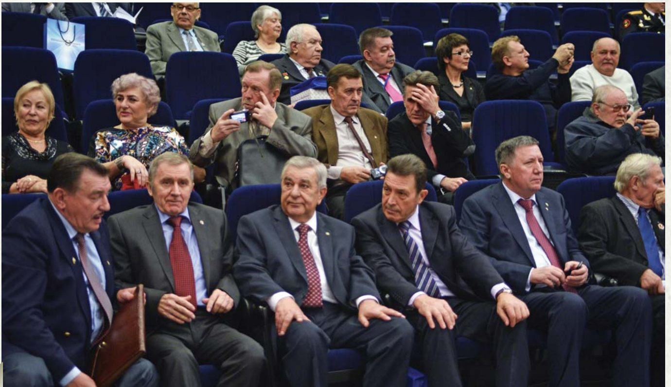
Veterans in the meeting room