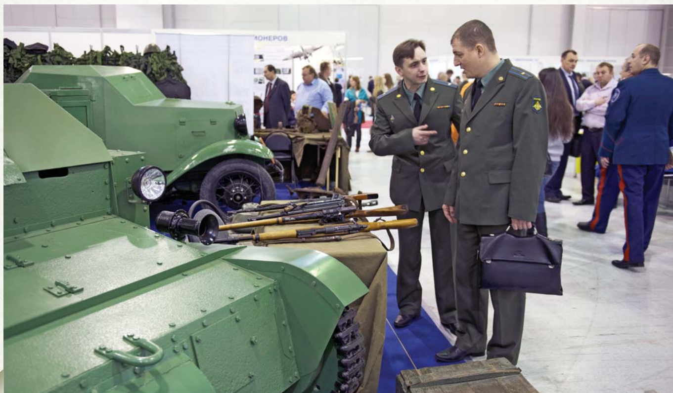
Students of military academies among the visitors

Во-вторых, один из важнейших вопросов, который сегодня стоит перед страна-