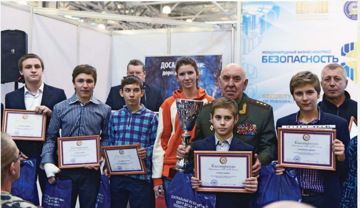
Gratitude from Russian DOSAAF (Voluntary Association for Assistance to Army, Aviation and Fleet)