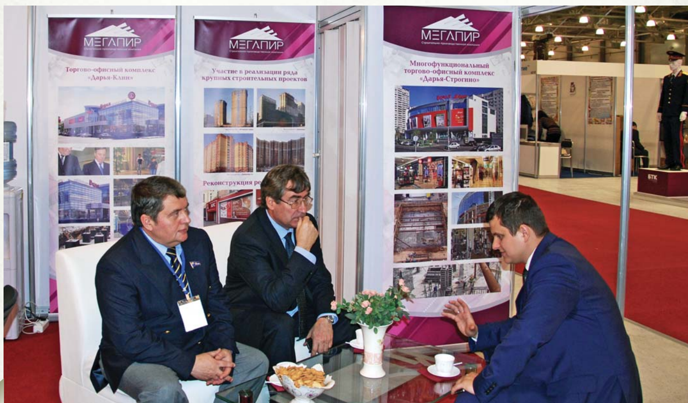
On the stand of "Megapir" construction and production company

При всем напряжении, которое существует в мире, мы должны вместе работать как один коалиционный орган и стремиться к решению этих проблем наилучшим образом. А данная задача не легкая, поскольку эти угрозы являются транснациональны-