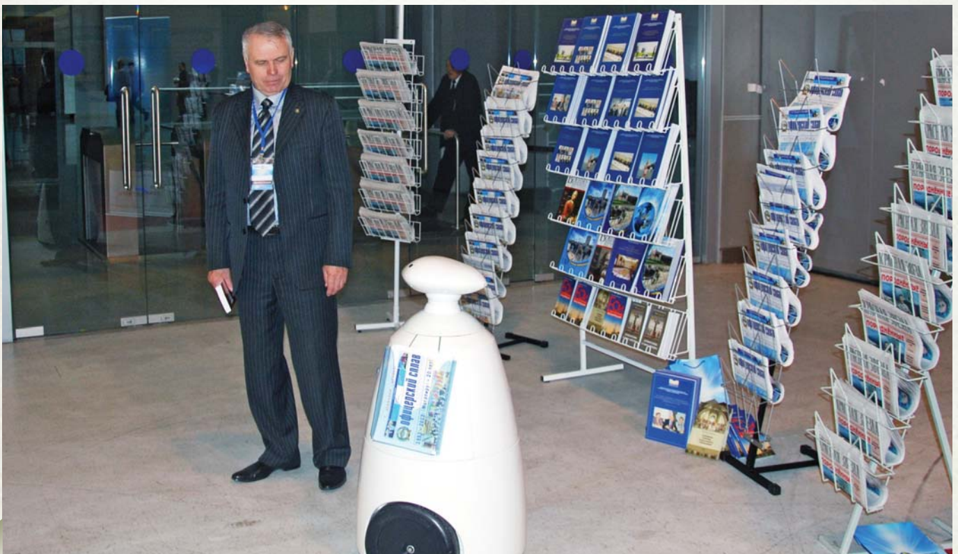
At the stand of the Congress media sponsors

И страны ШОС, в которые входит и Казахстан, государство, которое я представляю, в настоящее время принимают более конкретные, целенаправленные меры, чтобы сохранить стабильность в регионе ШОС. Я думаю, в этом отношении есть определенные положительные подвижки.