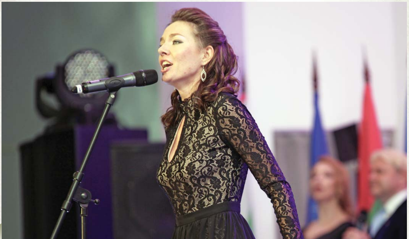
During a concert