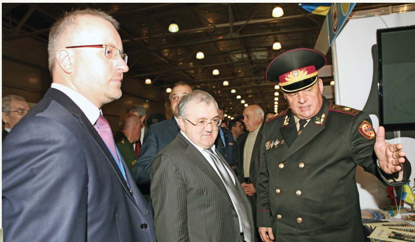
Exposition of Ukrainian EMERCOM

А теперь гуманное в целом правительство Пакистана занимается вопросом их реабилитации. И многие становятся на истинный путь. И это еще раз