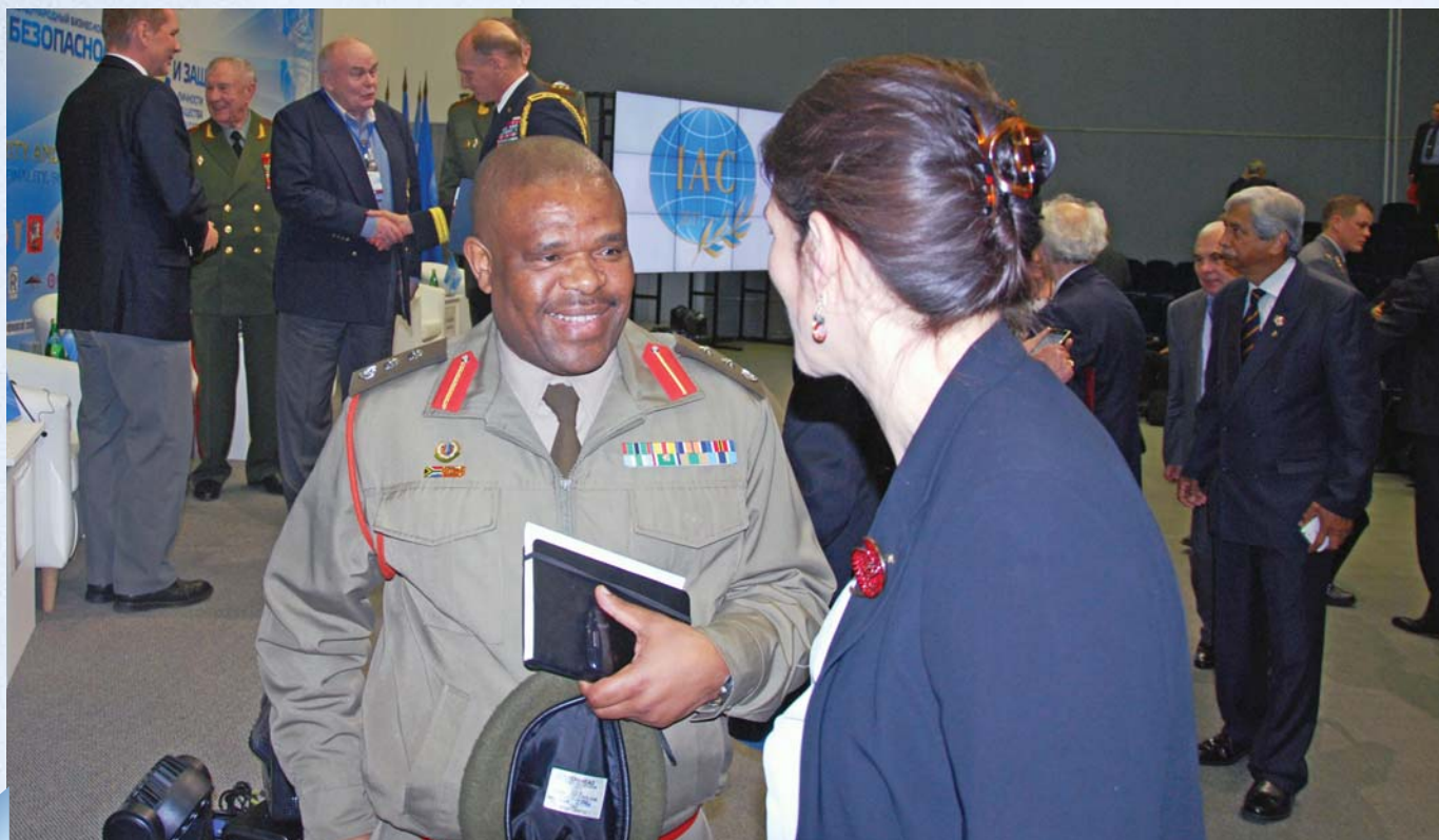
Representatives of the diplomatic corps