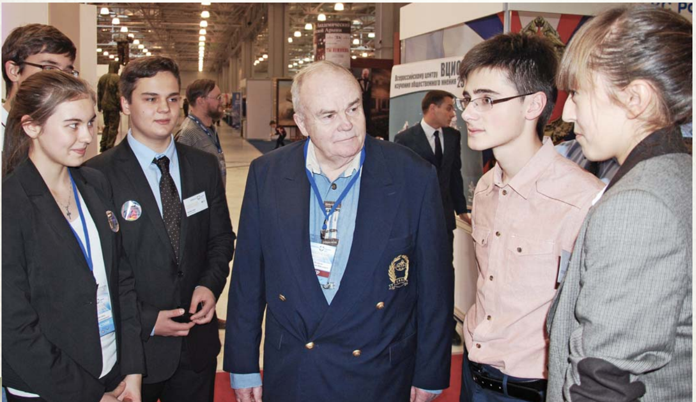
Academician E. Velikhov with young participants of the congress

Академик Е. Велихов с молодыми участниками конгресса