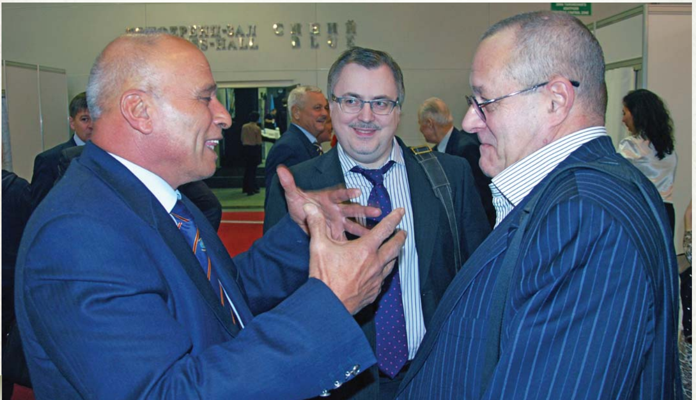
Hot debate on the Middle East affairs

Как известно, 18 июля 2012 года в аэропорту Бургас, в нашей стране, был совершен теракт, вследствие которого погибли 7 человек, были ранены 35 человек. Это трагическое событие подтвердило в очередной раз объективную необходимость принятия адекватных мер компетентными государственными органами и неправительственными организациями в сфере