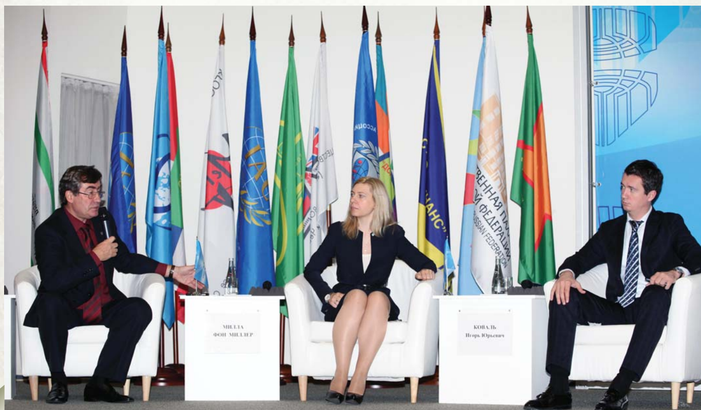
Section "Investment and financial markets, investment security" at work

И, конечно же, нужно возвращаться к тому, как было при Советском Союзе. Обязательно должно быть какое-то министерство или ведомство, которое