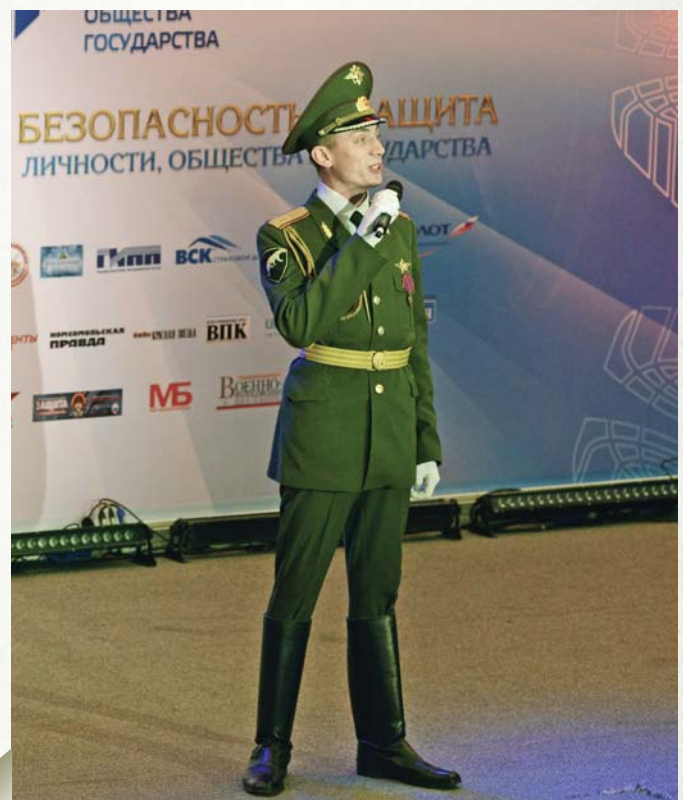
During a concert