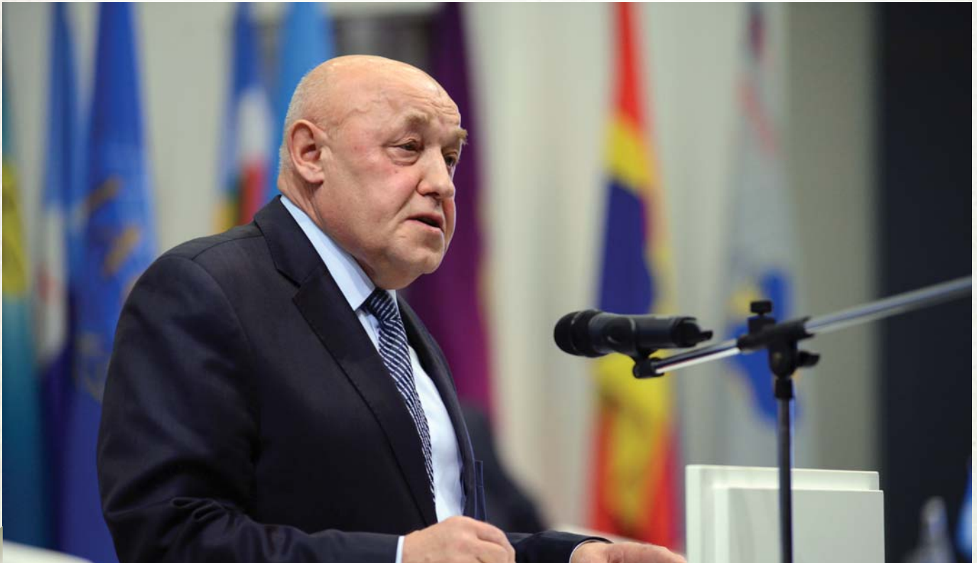
The floor is given to Deputy Secretary of the Security Council (2008 - 2012), Four-star General Yu. Baluyevsky Выступает заместитель Секретаря Совета безопасности (2008 – 2012 гг.) генерал армии Ю. Балуйевский