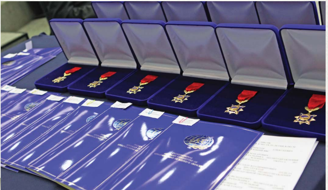
IAC Awards Награды МКК