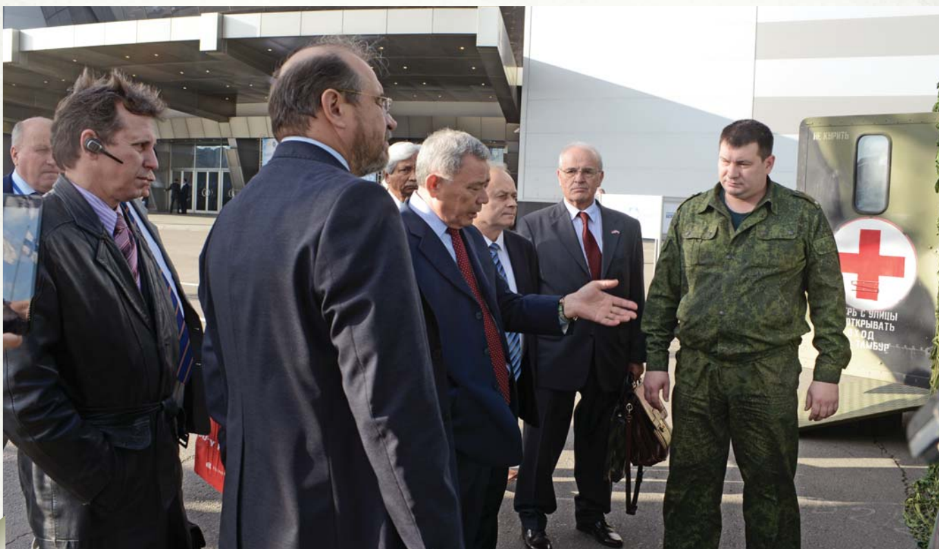
Foreign colleagues get to know the Russian system of medical support

Поэтому мы как раз обсуждаем вопрос, о котором Президент МКК говорил. Это вопрос о таком соглашении с Международным консультативным Комитетом. Это, конечно, для нас будет очень интересно,