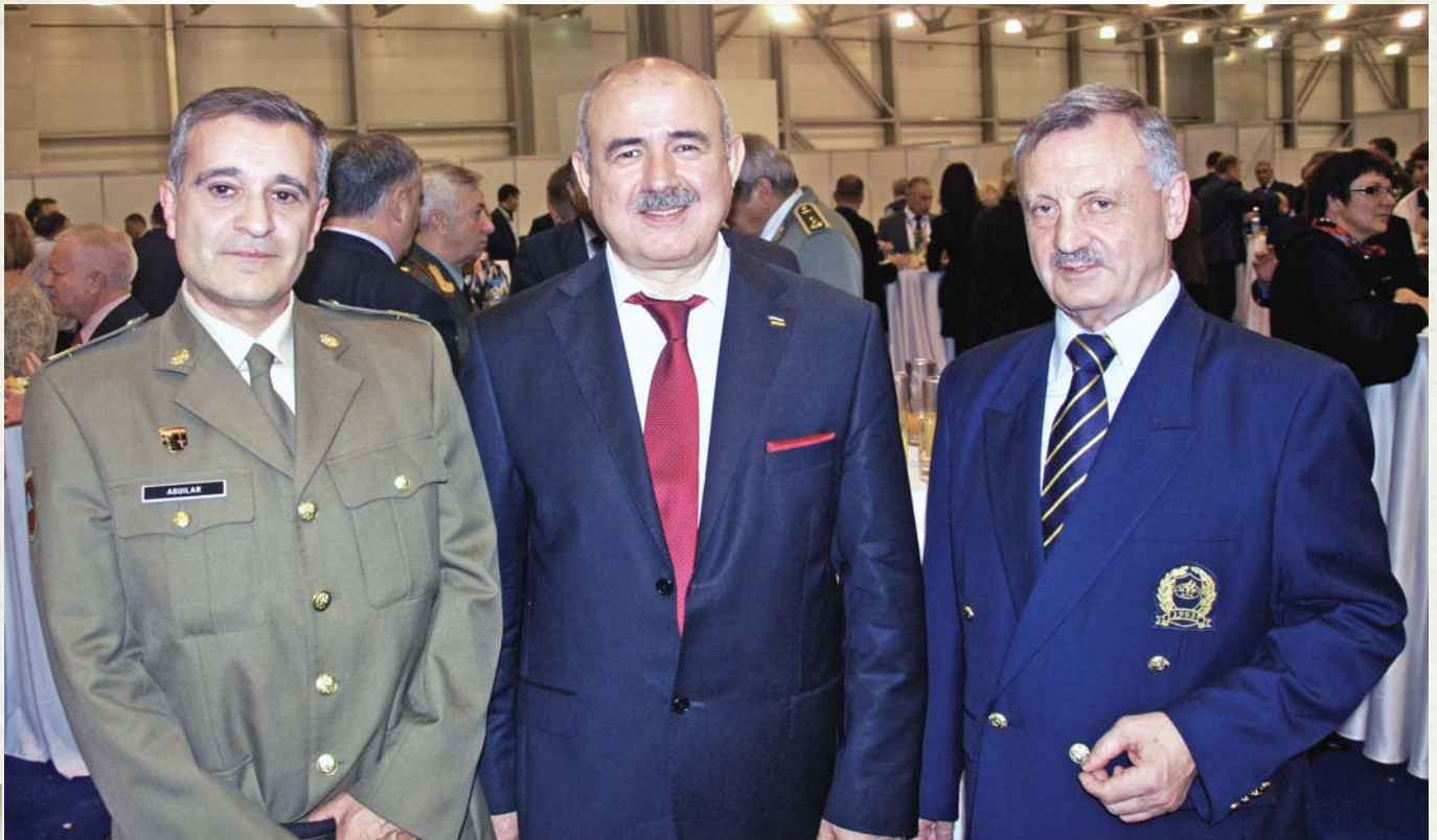
Picture for memory