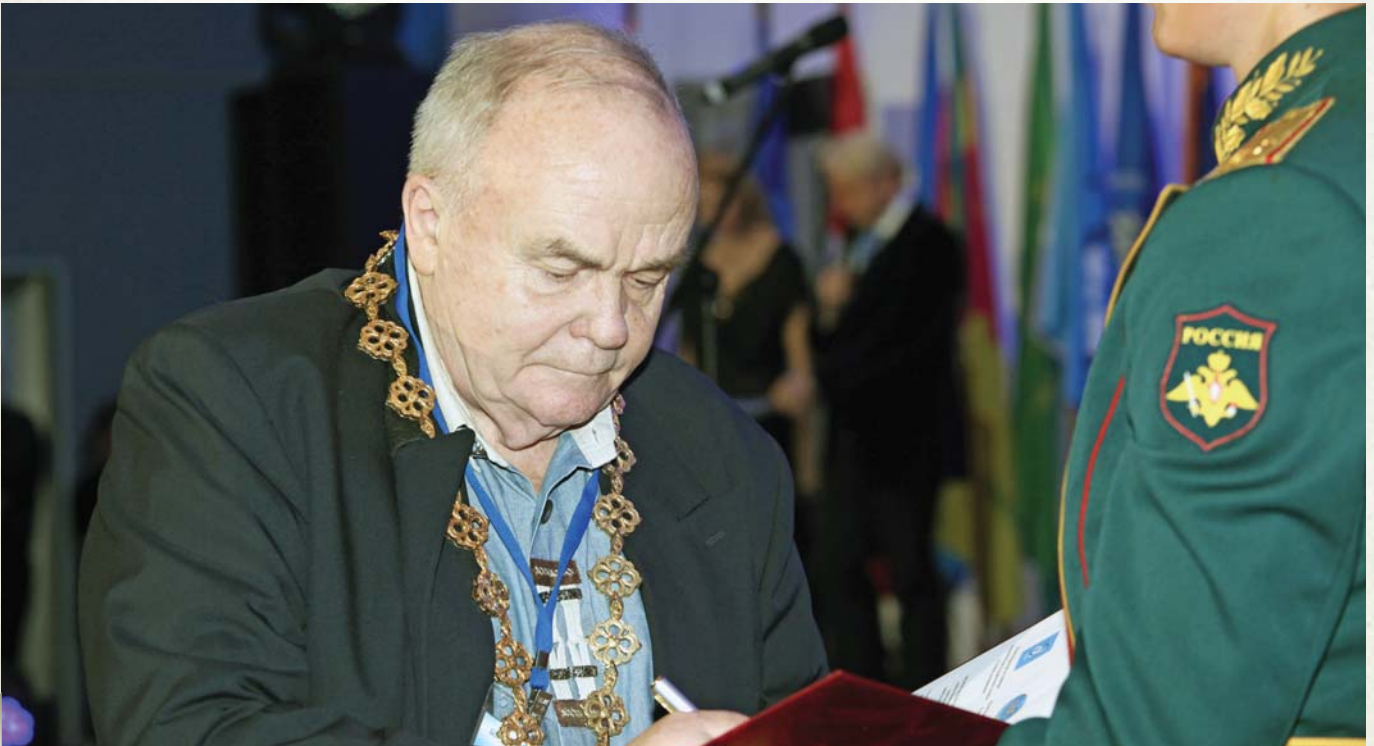
President of the International Association of Economic and Social Councils and Similar Institutions Academician E. Velikhov on behalf of his organization signs an agreement on cooperation with the IAC

Президент МЭСССИ академик Е. Велихов от лица возглавляемой им организации подписывает договор о сотрудничестве с МКК