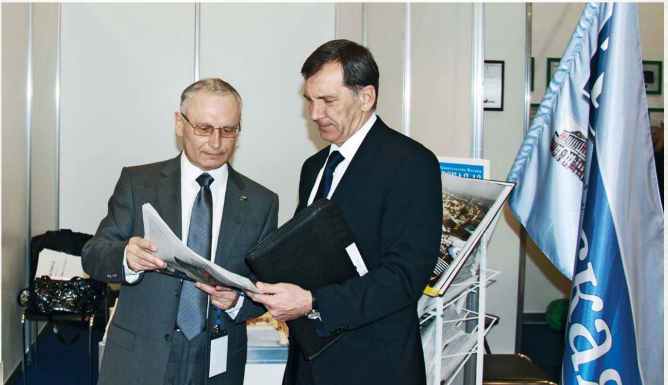
Military diplomat from Hungary (in the middle) is speaking with a media representative

Всемирная Федерация ветеранов, представляющая по сути всех ветеранов, с первых дней своего существования еще более 40 лет назад взяла на себя ответственность за противодействие терроризму. Приверженность данному курсу закреплена и в последней резолюции Всемирной Федерации ветеранов № 31 от 2009 года под наименованием «Меры по противодействию терроризму», в которой отмечены 10 пунктов по усилению давления на международное сообщество в части противодействия терроризму.