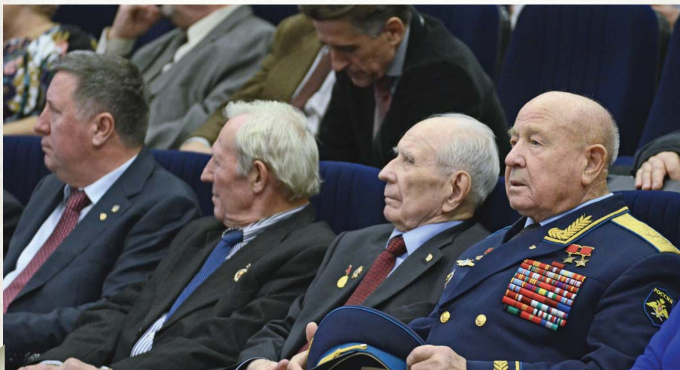
The meeting room of the Congress is attended by pilot-cosmonaut, the first man to walk in space, twice Hero of the Soviet Union, Major General E. Leonov (on the right)

Каждые два года избирается головная Общественная палата, которая координирует работу всей Ассоциации Общественных палат и социально-экономических Советов и похожих организаций.