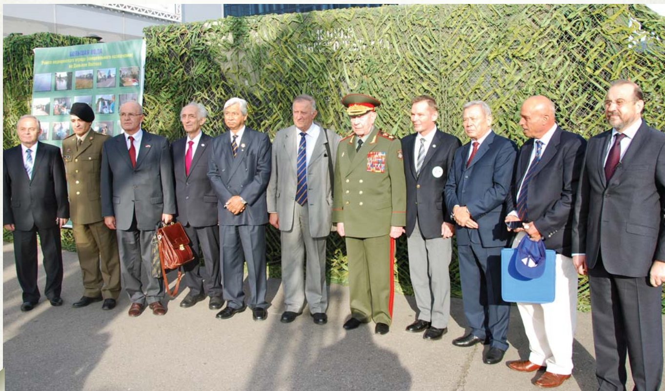
Foreign delegates: picture for memory

Во-вторых, мы проводим научно-практические конференции, семинары, «круглые столы» по этой теме. Например, мы провели в Софии научно-практическую конференцию «Международный терроризм