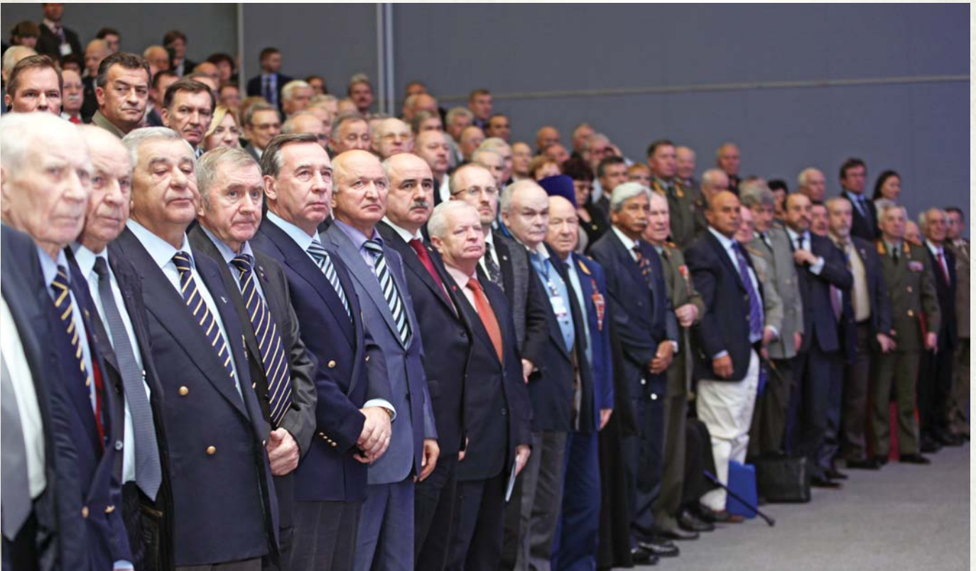
A minute of silence in memory of the fallen comrades Минута молчания в память об ушедших товарищах