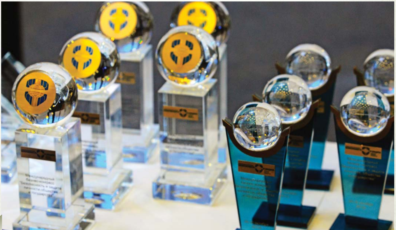
Awards for the participants of the International Congress

Слева направо: Президент МКК А. Каньшин, член Общественной палаты РФ В. Лагкуев, Посол Южной Осетии в РФ Д. Медоев