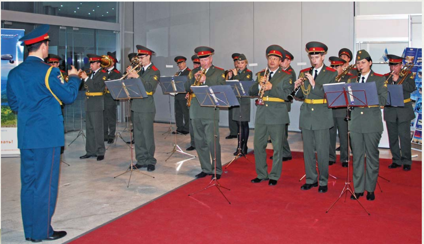
Visitors are greeted with orchestra

Ситуация заметно улучшилась, - к сожалению, так часто бывает, - после того, как в Азиатско-Тихоокеанском регионе действительно появилась реальная угроза, в том числе реальная угроза применения ядерного оружия. Я имею в виду ситуа-