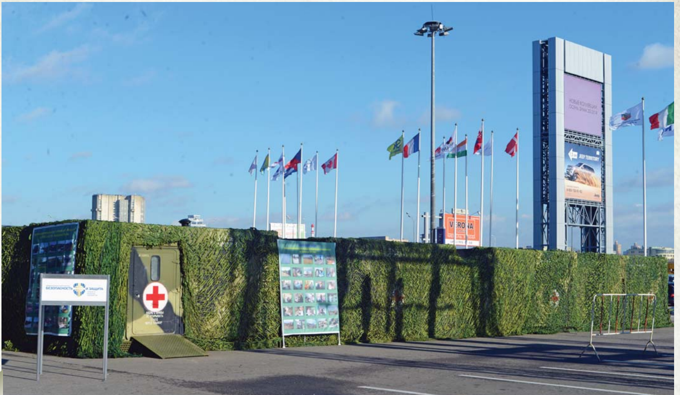
Part of the exhibition is dedicated to a special purpose medical detachment