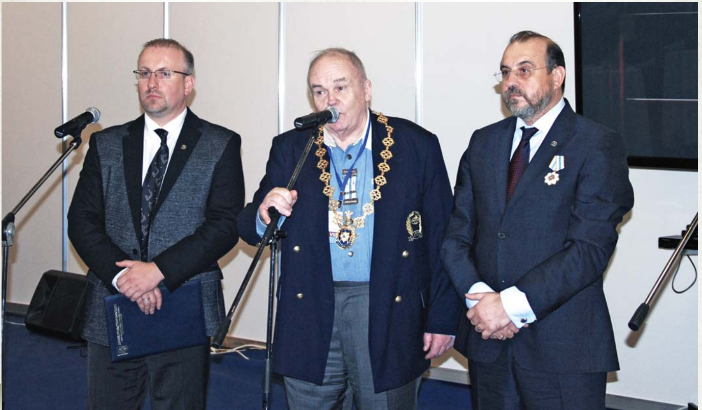
At the opening of the Congress unofficial part На открытии неформальной части конгресса