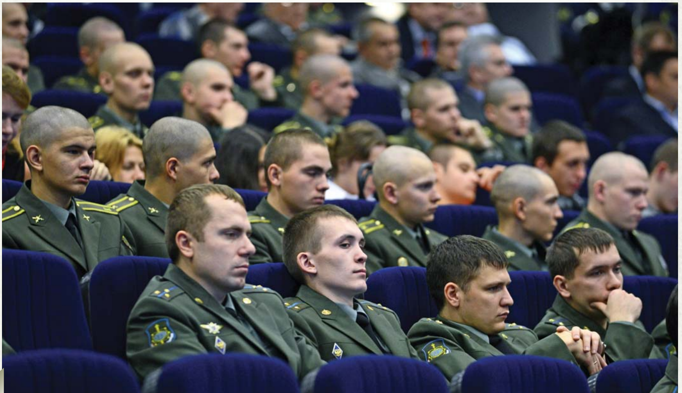
Future of the Russian army