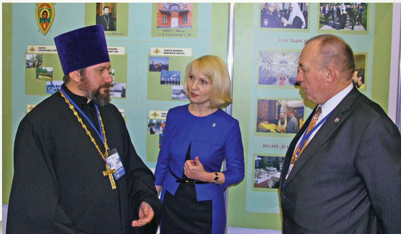
Russian Orthodox Church among the participants of the Congress and exhibition

Эти террористические угрозы в целом в регионе нарастают. И они изменяют свой характер. Те части Восточной Азии, которые всегда считались либо стабильными, либо не имели заметного повышения террористической опасности,