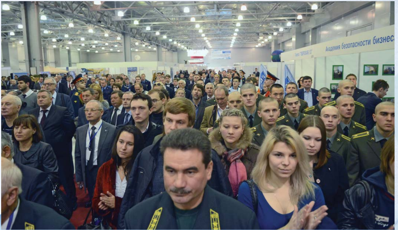
Several thousand people attended the exhibition during its first day

В первый день выставку посетили несколько тысяч человек