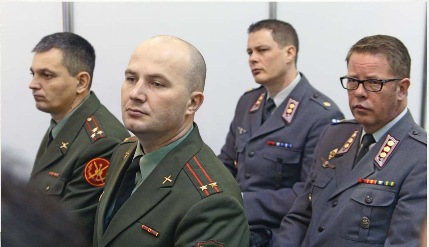
Representatives of Russian military academies and military diplomatic corps of Finland

И мы считаем, что и в России Северный Кавказ никогда естественно не был террористическим районом, а это нагревается и вызывается с определенными политическими целями.