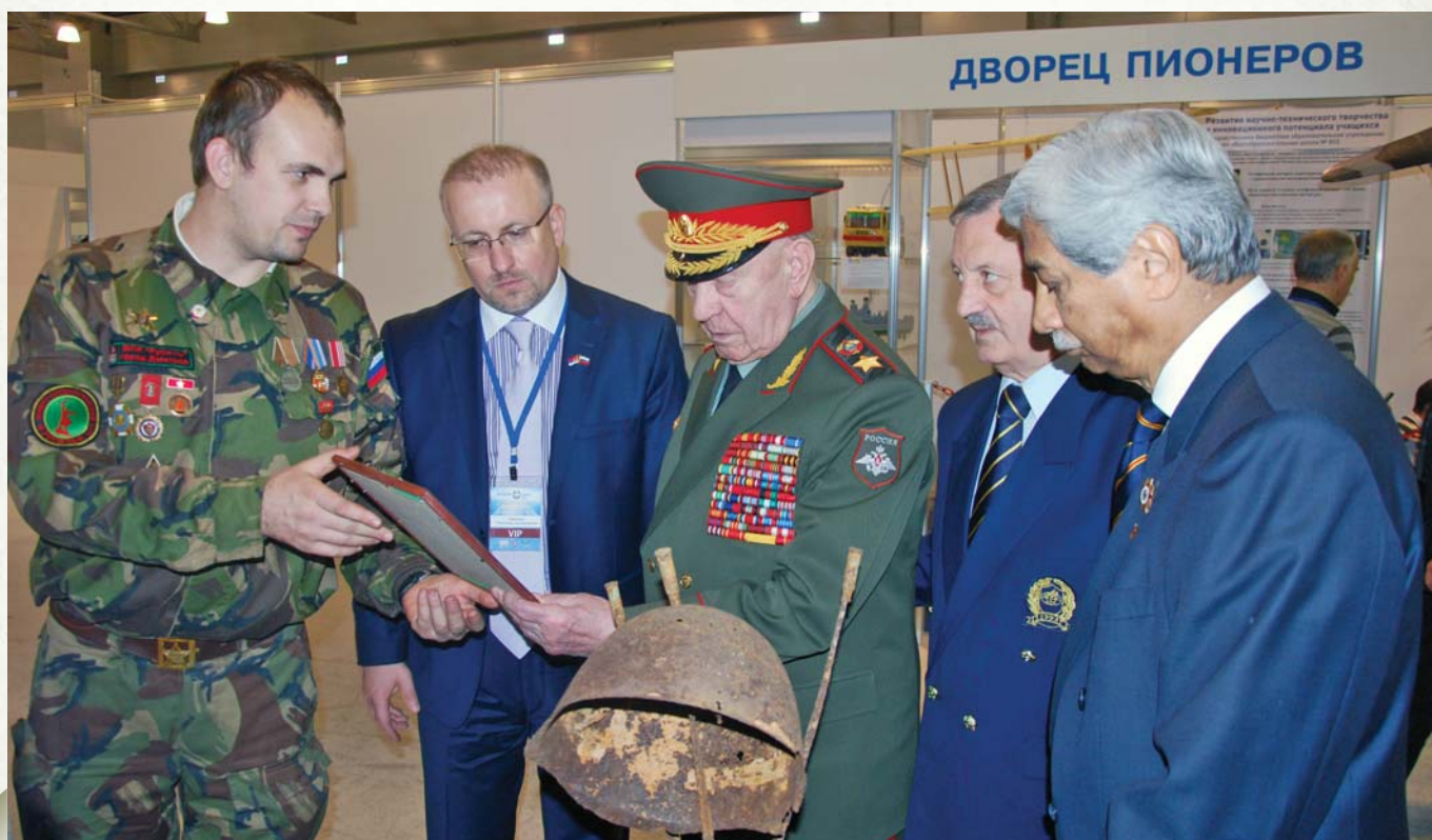
Marshal D. Yazov (in the middle) is getting to know the searchers' stand

Без этого, я думаю, они будут разрастаться, они будут делать все, что хотят, и наносить все больший ущерб человечеству. Полагаю, и так же считают большинство людей во всем мире, что террористы – это как вирус или бактерии, которые легко разрастаются в ослабленном организме. Поэтому нужно, чтобы наши службы были более сильными, чтобы они были в состоянии противодействовать терроризму.