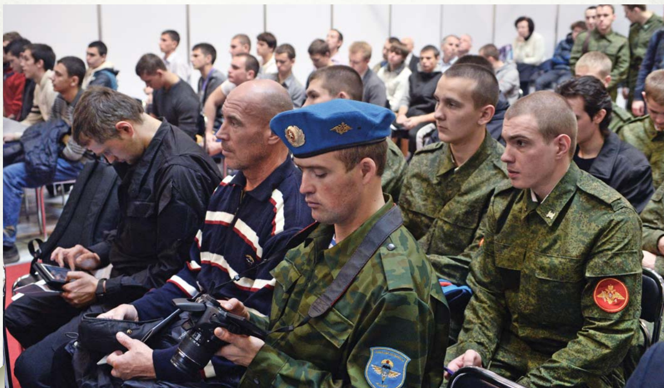
Soldiers of different arms and troops together on one of the congress sections

На севере и северо-востоке Сирии Аль-Каида через свои прокси под названием