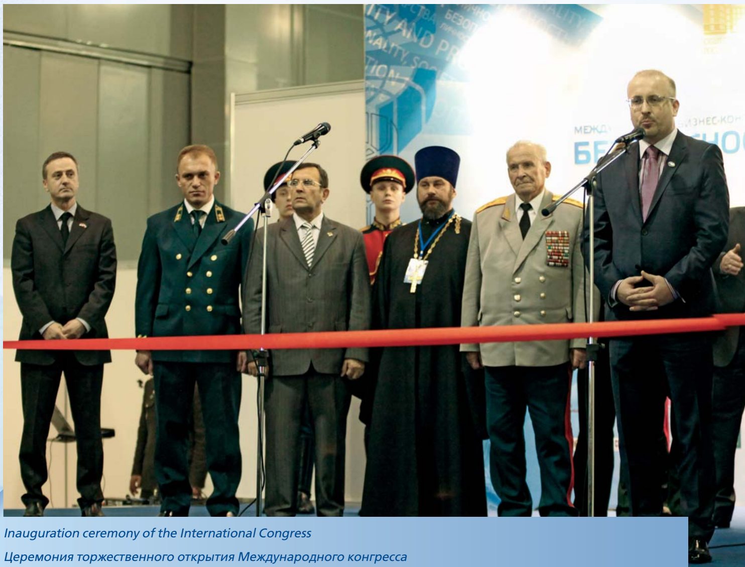
Inauguration ceremony of the International Congress

В конгрессе приняли участие представители Федерального Собрания России, Счетной палаты России, Минобороны, МВД, МЧС, ФСКН, Минюста, Минэкономразвития, Рособоронзаказа, Рособоронэкспорта, правительства Москвы и представители правительств республик и краев, Общественные и Торгово-промышленные палаты России и других стран, крупные производственные объ-