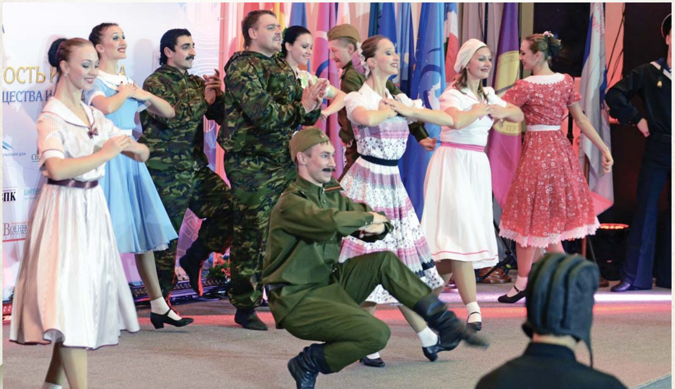
Performance by the Cossack ensemble