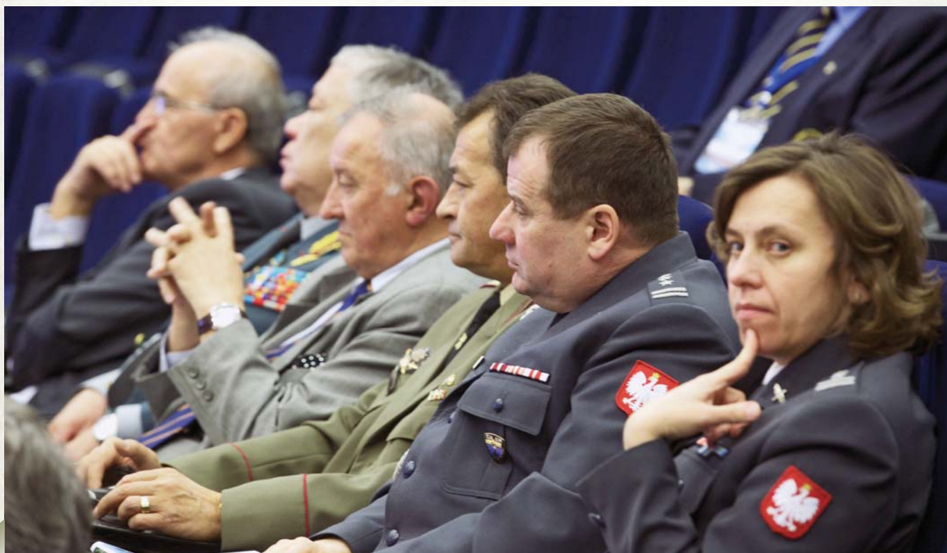
Representatives of the diplomatic corps from Poland, Bulgaria, Serbia and Kazakhstan

Мы летали в горы на вертолетах, район Сват, провинция Кишала и видели многие регионы, участки территории, крупно населенные, которые абсолютно не подчинены центральной власти. Там существуют законы шари-