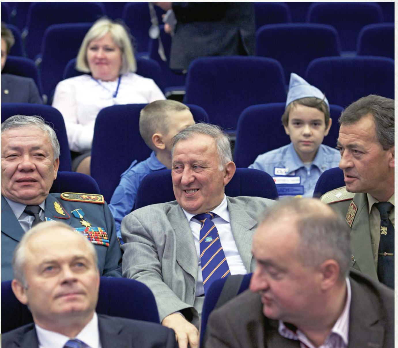
IAC representatives and diplomats

На конференции представлен достаточно серьезный состав участников из широкого спектра стран, поэтому я думаю, что мы вправе еще раз обратиться к мировому сообществу и сказать «Нет» международному терроризму как серьезной угрозе мировой цивилизации. Нужно сделать все, чтобы наши дети, наши внуки жили в мире, в котором не было бы места мировому терроризму.🕒