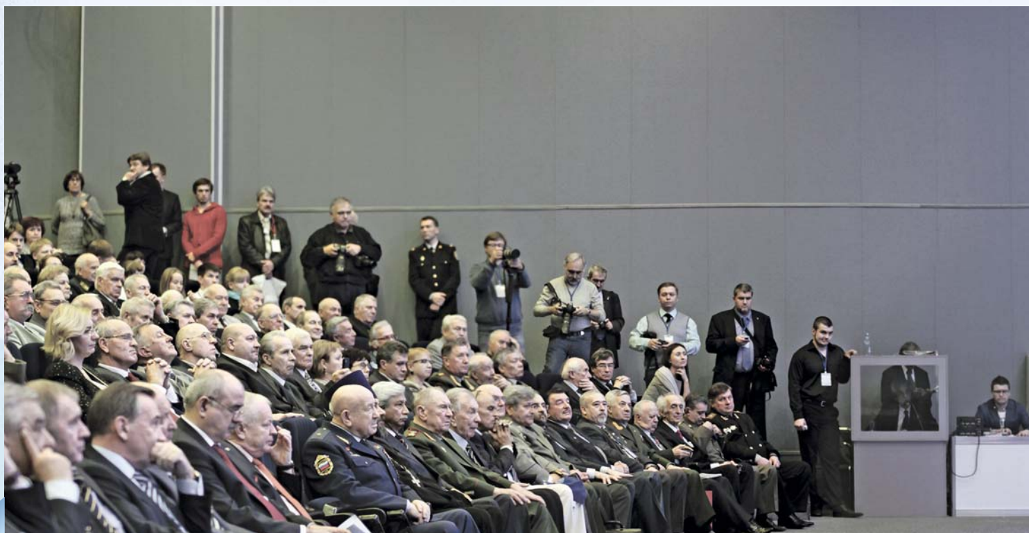
Speech by President of International Association of Economic and Social Councils and Similar Institutions Academician Evgeny Velikhov

Вопросы, вынесенные в тематику форума, изучались и обсуждались на его общих мероприятиях, пленарных засе-