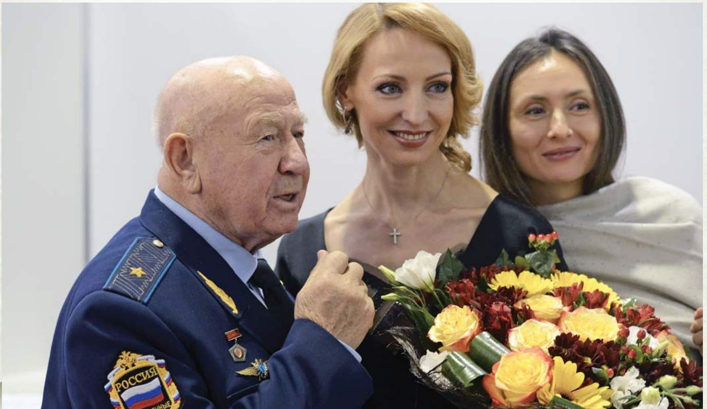
Flowers for the ballerina Цветы для балерины