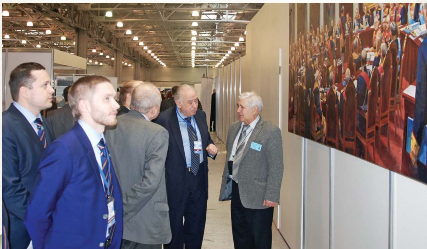
Succession of generations

На сегодняшний день надо сказать всему мировому сообществу спасибо Президенту Российской Федерации Владимиру Путину, что он буквально потушил очаг войны в Сирии своими неординарными инициативами, в результате кото-