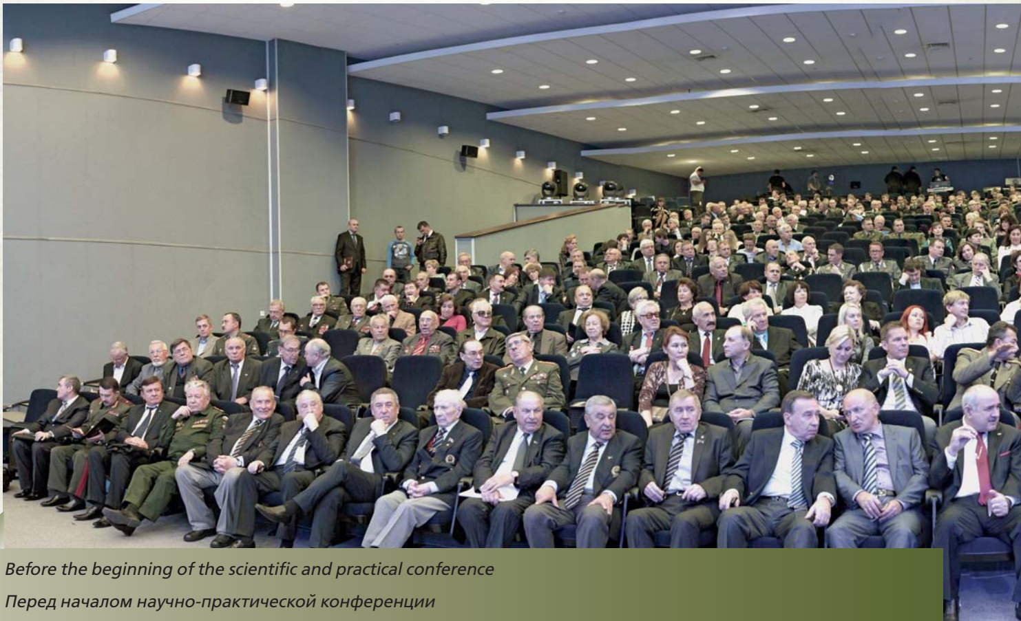
Before the beginning of the scientific and practical conference

Вместе с этим есть целый ряд групп в Центральной Азии и на территории Китая, ко-