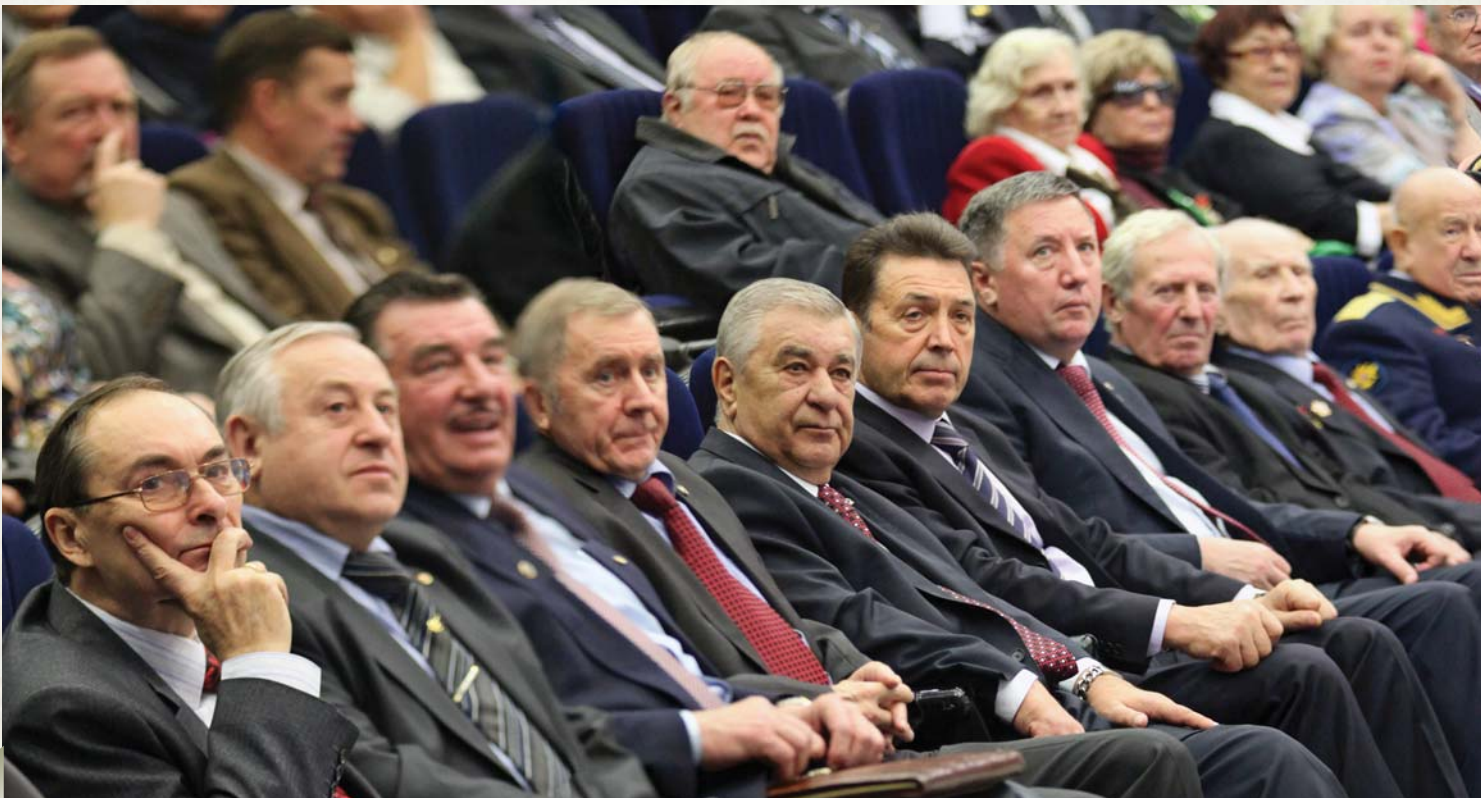
In the meeting room of the Congress

В основу обсуждения проблем, связанных с борьбой с терроризмом, мы ставим реализацию потенциала наших специалистов и экспертов по следующим основным направлениям деятельности: раннее предупреждение – анализ тенденций угроз от совершения террористической деятельности на территории государства и подготовка терактов, реализация которых задумана на территории других государств; недопущение создания террористических организаций; содействие государственным институтам в кризисных ситуациях, вызванных совершением терактов с целью минимизирования их последствий; содей-