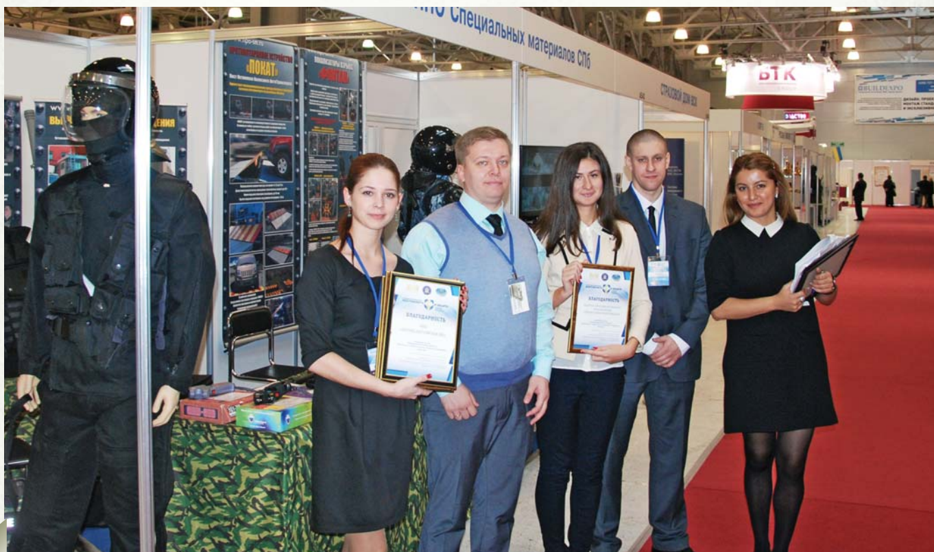
Participants received diplomas

Конечно же, это обман. И эти молодые люди, которые вербуются еще, как мы говорим, в школьном возрасте, они верят и идут в боевики. Буквально полтора-два месяца назад я вернулся из командировки в Пакистан. Эта исламская республика испытывает определенные трудности, я бы сказал, серьезные проблемы от того, что в Афганистане проводится коалиционными силами операция, длящаяся уже в течение 10 лет, «Несгибаемая свобода».