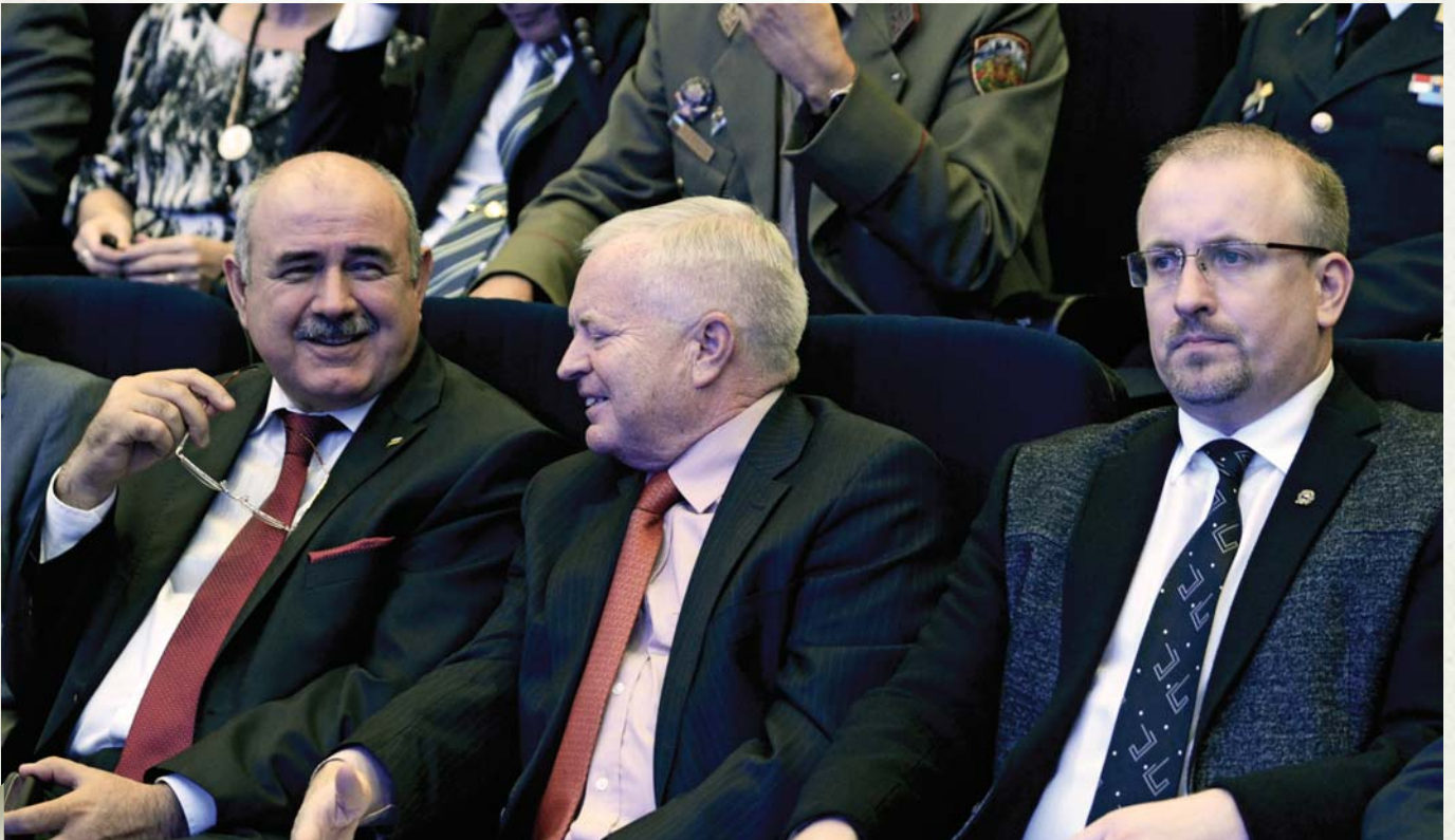
Ambassadors of South Ossetia (left) and the Slovak Republic (in the center)