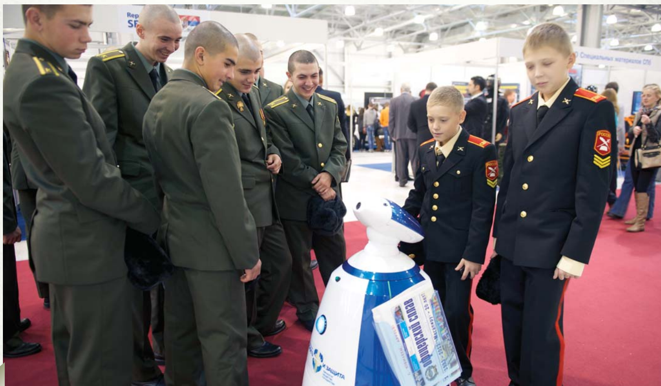
Cadets military academy students are studying the exhibits

И мы хотим от имени Международного консультативного Комитета выработать предложение – обращение к главам го-